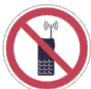
Rádiótelefon használata tilos