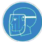
Arcvédő használata kötelező