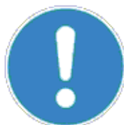
Általános utasítás (kiegészítő jelzéssel)