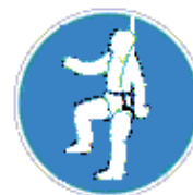
Testhevederzet használata kötelező