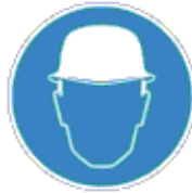
Fejvédő használata kötelező