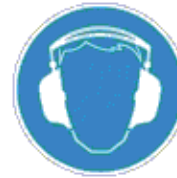
Hallásvédő használata kötelező