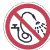
Vízzel locsolni tilos