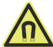
Erős mágneses tér