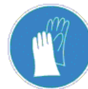
Védőkesztyű használata kötelező