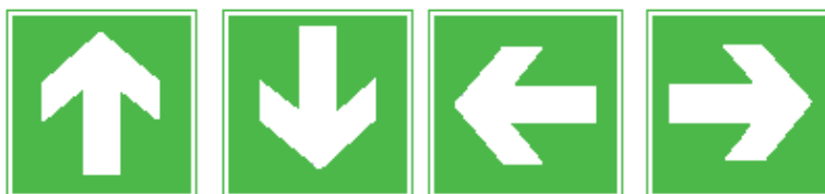
Íránymutató (kiegészítő táblaként)