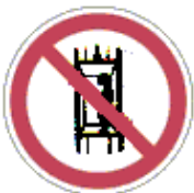
A felvonón személyszállítás tilos