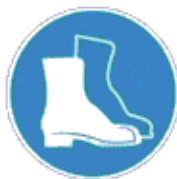
Lábvédő használata kötelező