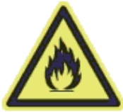
Gyúlékony (tűzveszélyes) anyag vagy magas hőmérséklet (ha a magas hőmérsékletre nem figyelmeztet külön jel)

Fekete piktogram sárga alapon, fekete szegély. A sárga szín a jel felületének legalább 50%-át teszi ki.