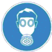
Légzésvédő használata kötelező