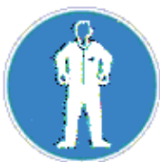
Védőruha használata kötelező