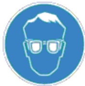
Védőszemüveg használata kötelező

Fehér piktogram kék alapon. A kék szín a jel felületének legalább 50%-át teszi ki.