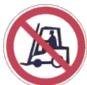
Szállítóeszközzel behajtani tilos