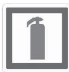
3. számú ábra Tűzoltó készülék

Az alagúttól ajtóval elválasztott segélykérő fülkékben magyar, angol és német nyelven feltüntetve, jól látható szövegnek kell jeleznie, hogy a segélykérő állomás tűz esetén nem nyújt védelmet. Erre vonatkozik a következő példa: