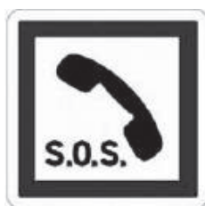
2. számú ábra Segélykérő telefon

A segélykérő állomásokat tájékoztató jelzésekkel kell ellátni, amelyek a közlekedők rendelkezésére álló eszközöket jelzik, mint például: